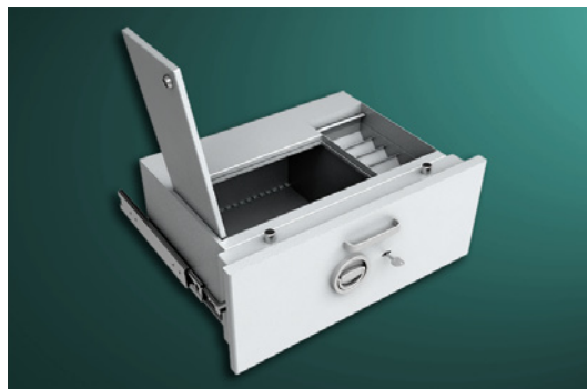
Sonderschublade (Modelle D-204 und D-205) mit Münzablagefach vorne