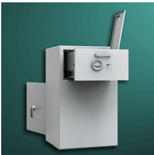
Rearload-Deposit, mit rückseitiger Einwurfschublade

* zuzüglich Scharniere, 60 mm vorstehend