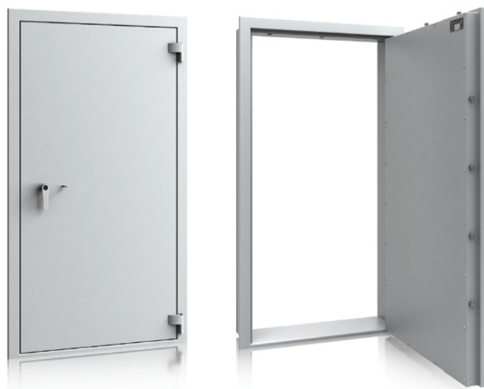
Waffenraumtür Klasse 1 / I nach EN 1143-1 ECB-S zertifiziert