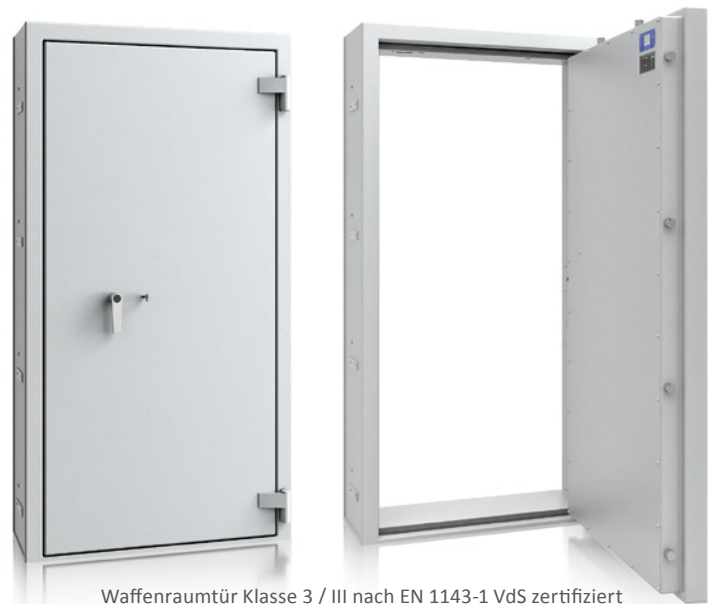
Waffenraumtür Klasse 3 / III nach EN 1143-1 VdS zertifiziert