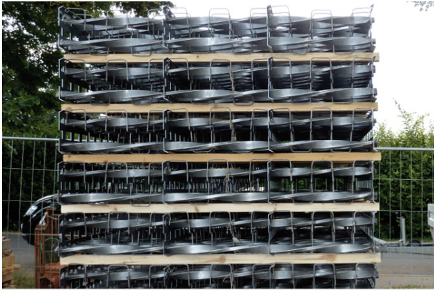
Lieferung des Armierungssystems