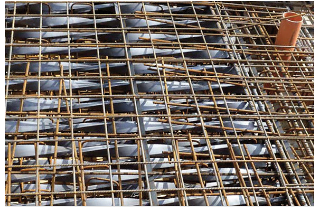
Verlegen der Sicherheitsarmierung