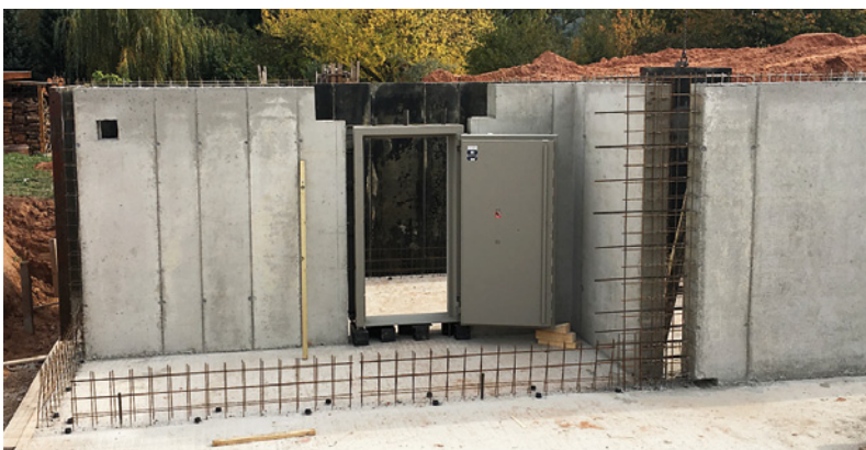
Einbau der Wertschutzraumtür (hier mit Tagesgittertür) während der Bauphase