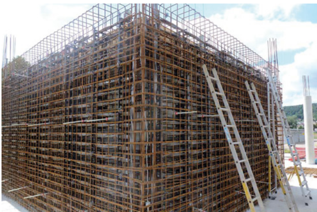
Montage der Sicherheitsarmierung in der Wand