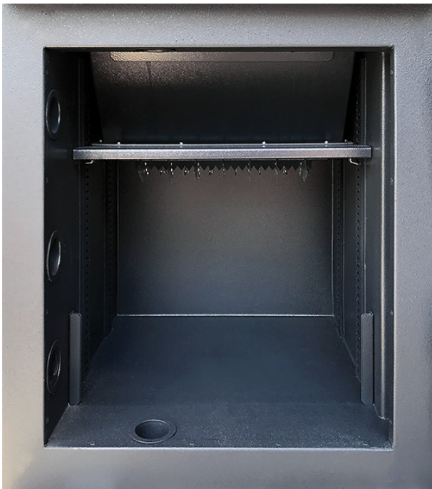
Innentresorraum ohne vertikale Trennwand