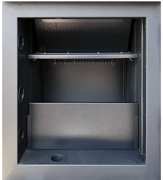
Innentresorraum mit vertikaler Trennwand