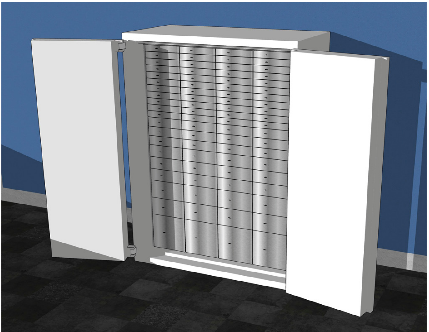
Abbildung: Konstruktionszeichnung einer Mietfachanlage in einem Wertschutzschrank