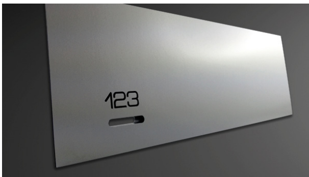
Aluminium natur, Fachnummern graviert