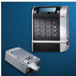
Wittkopp GATOR 6000 / 8000 / 9000 Level 10 oder Level 30