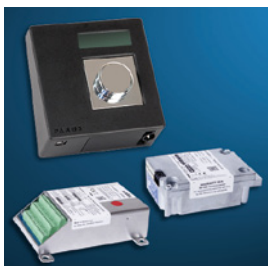
KABA PAXOS advance