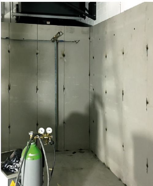
Aufbau Wandelemente (Verschweißung)