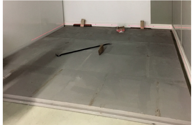
Verlegung des Modulraum-Bodens