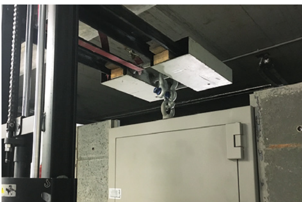
Setzen der Wertschutztür im Raum