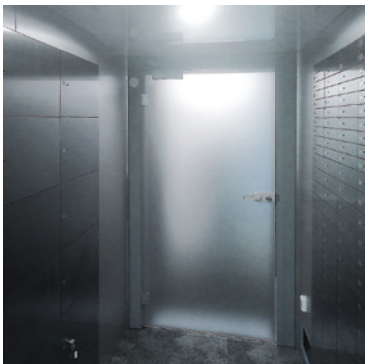
Abbildung: Sonderausführung Tagesgittertür

Standardverschluss bei Tagesgittertüren ist ein Profilzylinderschloss. Optional besteht die Möglichkeit der elektrischen Türöffnung durch einen elektronischen Türöffnerkontakt und die Zwangsverschiebung durch einen aufgebauten Gleitschienenschließer.