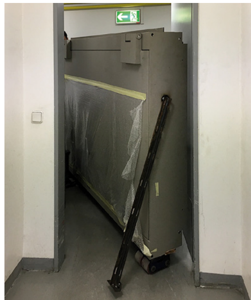
Transport der Wertschutztür