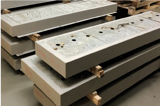
Anlieferung der Modulelemente